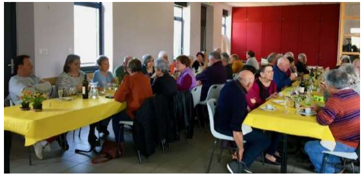
côté salle; les langues vont bon train