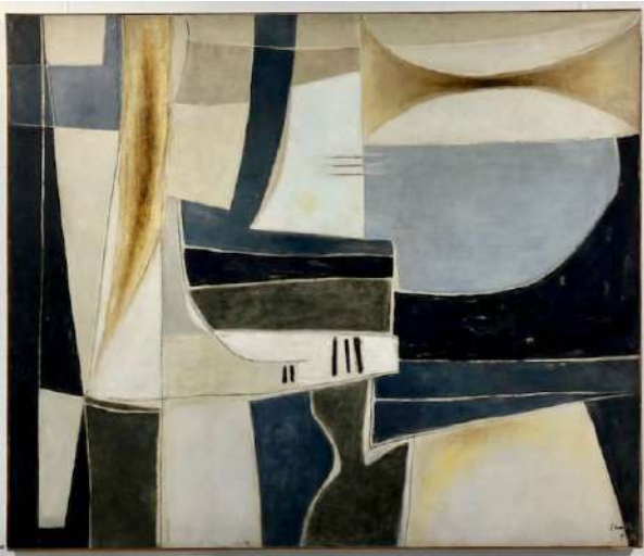
Exposition salle des convers Roger Chastel, le Piano