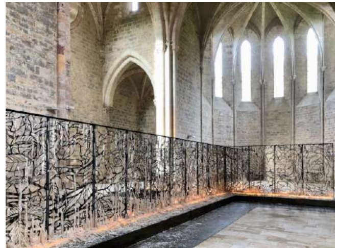
Le 13 mai, la haie de rosiers est révélée dans son ensemble après la fonte de la cire. Les bougies ont été éteintes.