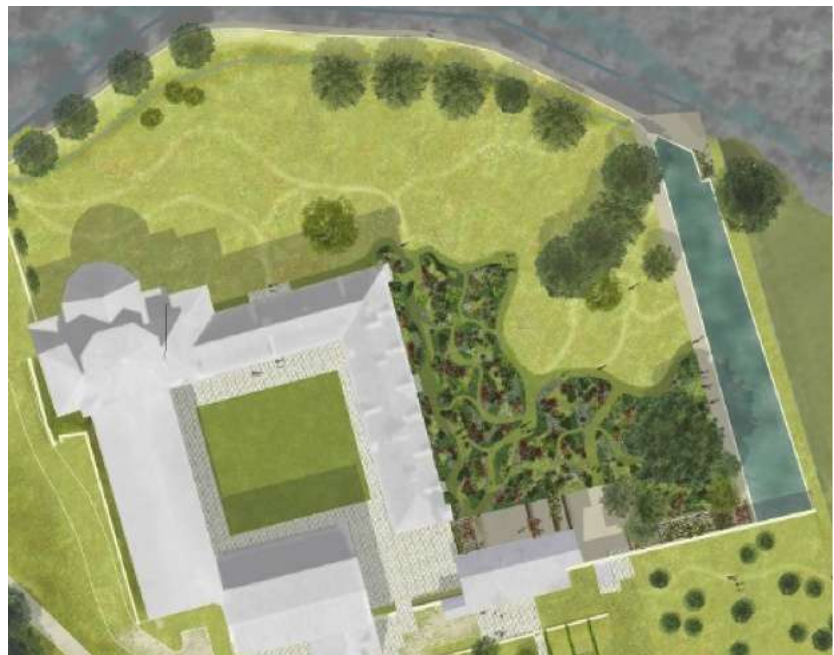
Plan du futur jardin

Conçu par le paysagiste Patrice Bideguain (Greenconcept), avec le soutien des Roses anciennes André Eve® et en partenariat avec l'Association des Amis d'André Eve, le jardin de roses de l'abbaye de Beaulieu reprend les grands principes du jardinier à qui il rend hommage. Il constituera un trait-d'union unique entre le monument, ses collections, et le paysage préservé de la vallée de la Seye.