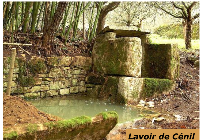
Lavoir de Cénil