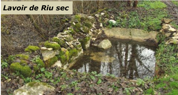
Lavoir de Riu sec

A la demande de la municipalité, nous allons tester une – (des) – randonnée(s) découverte (s) de 5/6 km, sur le plateau de Saint-Igne : le but est de faire découvrir ce magnifique hameau, son architecture caractéristique, les fours à chaux, les croix, le chaos gréseux, etc. Pour cela nous aurons besoin de la participation des habitants de Saint-Igne, Testas, La Lande, etc. (savoir, anecdotes, localisations, points de vue, éléments intéressants...).