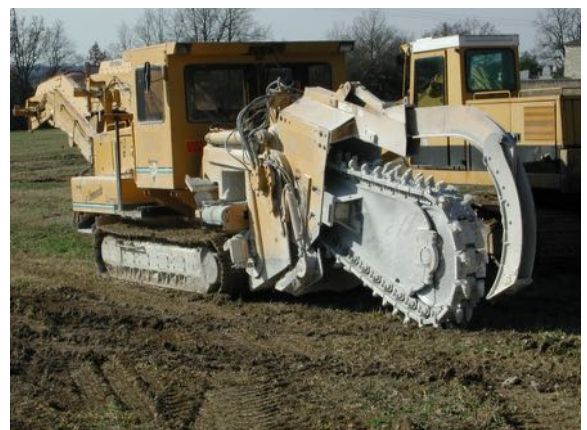
Une trancheuse pour enfouir les cables