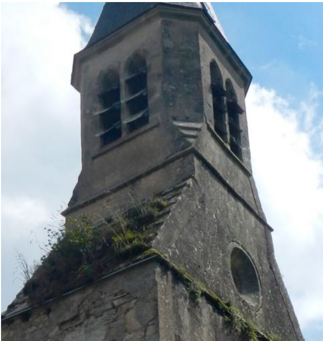
Église de Saint Igne

Pour l'Association « les bouchons d'amour » dont l'objectif est de financer des fauteuils roulants pour handicapés, tous types de bouchons en PLASTIQUE de moins de 12cm de diamètre, et n'ayant pas servi pour des produits dangereux, sont collectés à : - mairie de Ginals. - salle communale