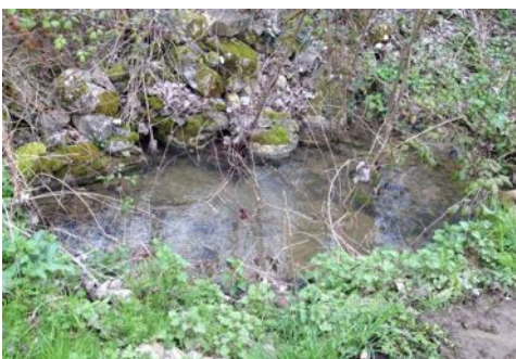
Ancien lavoir dégagé par l'association près de Rieussec

L'association étudie la possibilité d'intervention d'un Chantier International avec l'Association CITRUS pour revaloriser le petit patrimoine de Ginals : nous attendons vos propositions (chemins, murs en pierres sèches, casèles ou gariotes, fours, etc.)