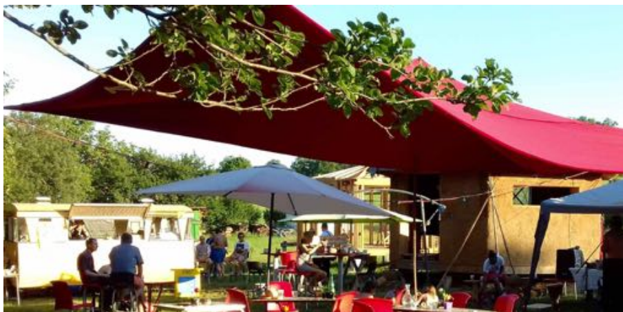
Stage de formation à Begayne cet été

Les inscriptions se font directement sur le site de 2Bouts/Friture notre partenaire ; https://www.friture.net/-programme-des-formations-a-la-construction-ecologique-