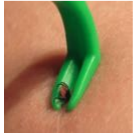
La pince à tique

Si vous en trouvez une, ne tentez surtout pas de la retirer en vous grattant mais utiliser une pince spéciale. Évitez l'éther. Une fois la tique retirée, désinfectez la zone.