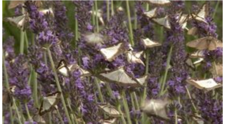
Invasion de pyrales, dans un champs de lavande, pour butiner!

Les plants largement infestés peuvent être arrachés et brûlés (ou broyés en fines lamelles) ou soigneusement enterrés. Il faut éviter le compostage à l'air libre qui laisserait les chenilles se métamorphosées en papillon !