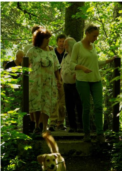
Rando-découverte du 13 juillet