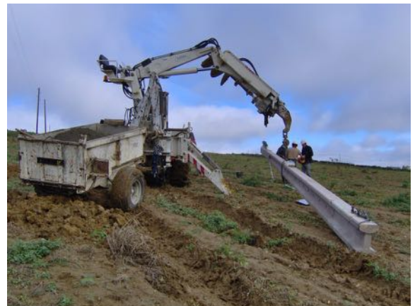
Retirer ou positionner les poteaux

D'ici la fin de l'année, une nouvelle étude sera engagée pour sécuriser le poste « 1 Village », au lieu-dit « Bach ». Les fils nus seront remplacés par des solutions plus résistantes aux aléas climatiques et de nature à assurer une meilleure qualité électrique.