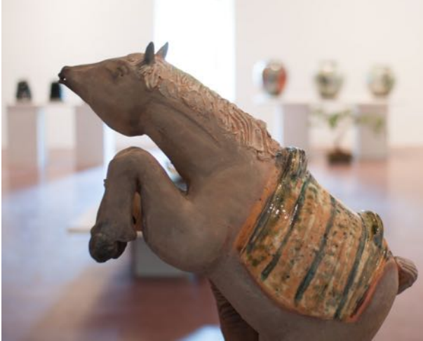
Exposition « Terres plurielles » 2015

Au nom de l'association, j'ai le plaisir de vous présenter mes meilleurs vœux pour 2016.