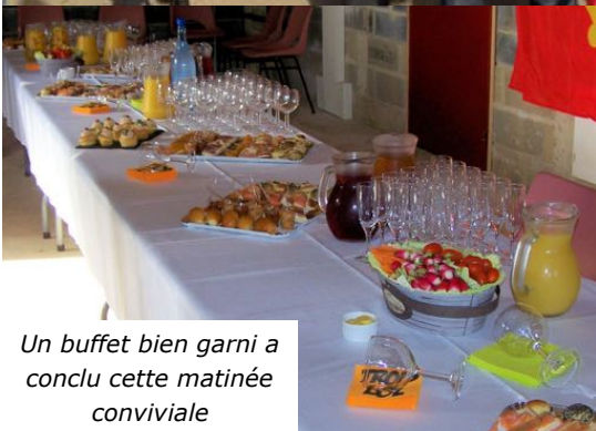
Un buffet bien garni a conclu cette matinée conviviale